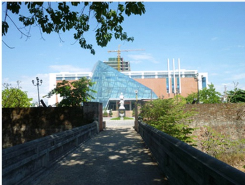
Lối vào hàng Đông cửa thành in Hi, hiện bảo tàng ở Nòng nòng cũ trong khuôn viên di tích này

Năm 1847 Thiệu Trị tháng 7, thành in Hi được mở rộng có chu vi 556m, cao hơn 5m, chung quanh là hào sâu 3m. Thành có 2 cửa, một cửa ở phía Nam (cửa chính), một cửa ở phía Đông. Trong thành có hành cung, có kitchen, các cửa sổ chia lợp thóc, nóc, thóc súng và cửa trang bị 30 súng đại bác của Pháp. Thành được xây bằng gạch theo kế hoạch thiết kế kiểu Vauban, hình vuông. Hiện nay, thành ở phía Tây, Đông và các góc thành đều còn nguyên vẹn, còn cửa thành phía Nam đã mất và phía Bắc đã sụp đổ. Ngày nay, di tích thành in Hi được trùng tu, gia cố, phục hồi nguyên trạng. Một thành lập ủy nghị của Trung ương Nguyễn Tri Phương đã được dựng tại đây, ghi nhớ mặt giai đoạn lịch sử hào hùng của thành phố.