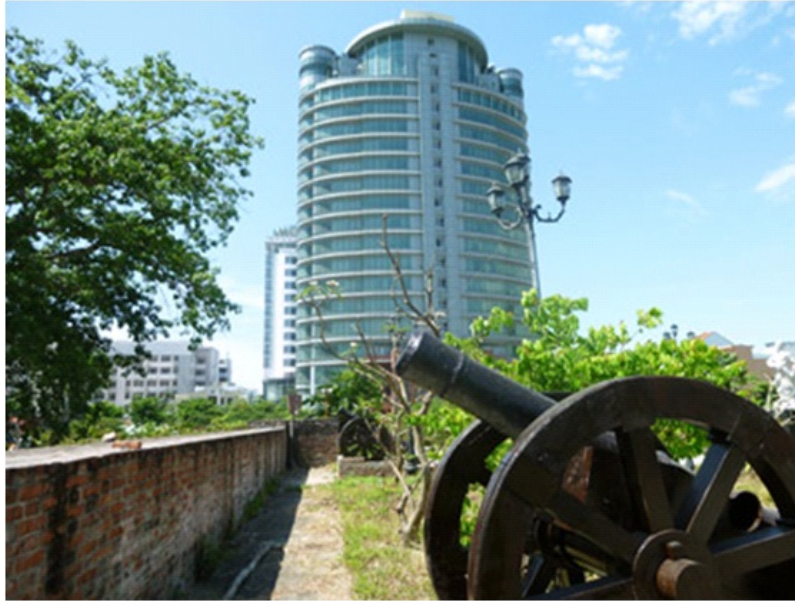
Nhng khu súng thn công ti thành in Hi

Nhng ti di tích thành in Hi li tip tc phát hin thêm mt khu súng thn công. Gn 200 nm trc, nhng khu thn công này cùng vi i quân triu Nguyn, di s ch huy ca danh tng Nguyn Tri Phng, ánh lui hàng chc t tn công ca quân Pháp ngay ti ca sông Hàn. Súng thn công c b trí trên các súng, quay mt ra phía bin sn sàng nghênh chin vi tàu ch.